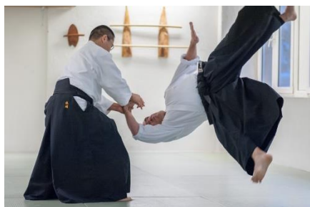
Tori (obránce) páčí útočnickovi ruku při jeho nejvyšší energii (útočníka)

Toto bojové umění bylo založeno v druhé polovině 20. století Ó-Senseiem Moriheim Uešibou. Oproti karate nebo judu je to poměrně mladé bojové umění. V aikido se nepořádají turnaje, závody a