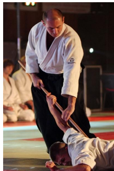
Obránce provádějící techniku s jo proti útočnickovi

s největší pravděpodobností ho nikdy nevidíme na olympijských hrách a i přesto si získalo popularitu. Dnes ho cvičí milióny lidí po celém světě. Každý se rozvíjí individuálně pomocí ostatních na žíněnce.